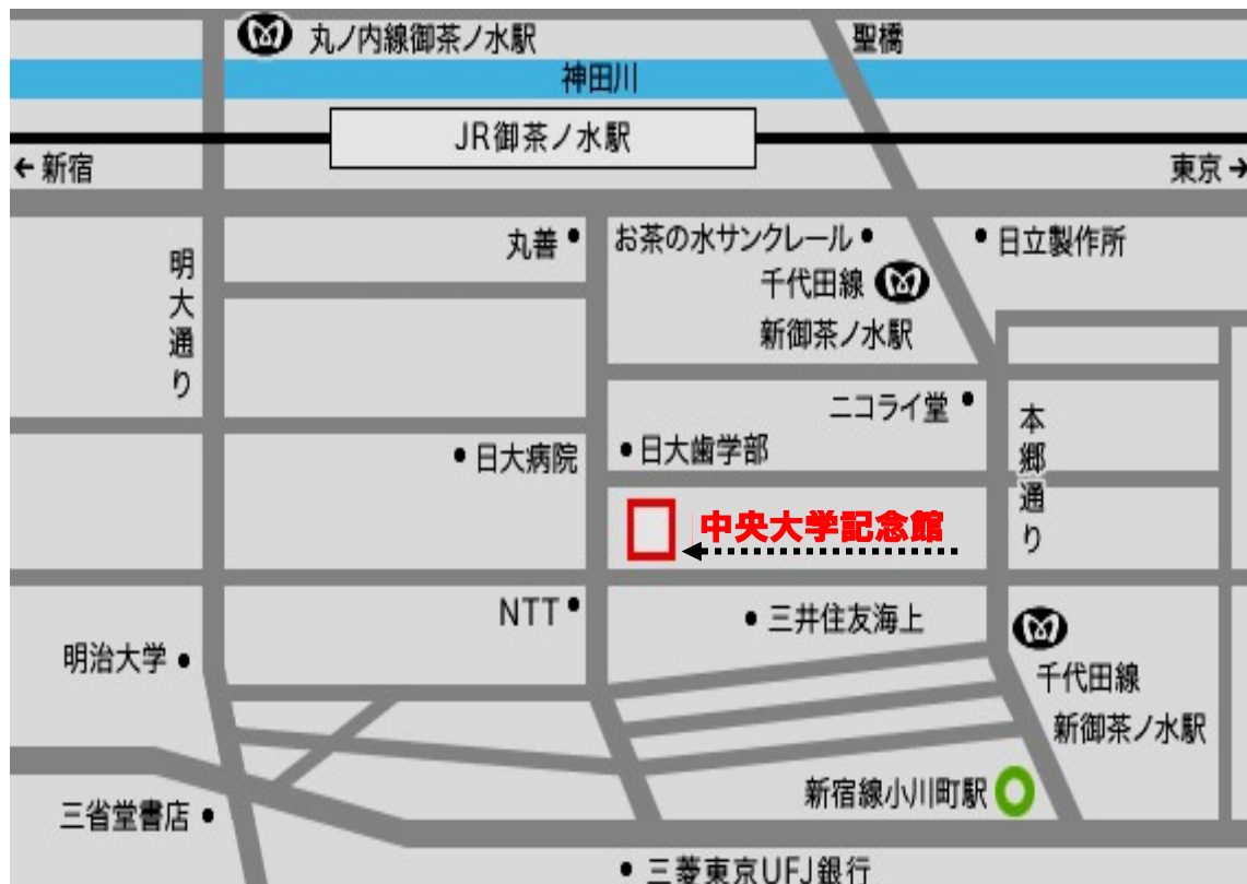
※1 中央大学駿河台記念館 (東京都千代田区神田駿河台 3-11-5 (TEL: 03-3292-3111))

※3→ ちよだプラットフォームスクエア本館 = 東京都千代田区神田錦町 3 - 21 (TEL: 03-3233-1511)